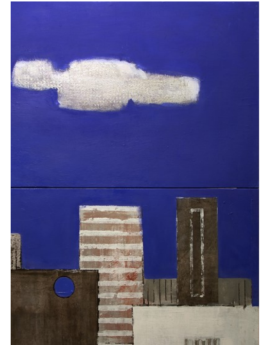
Roberto Dolso, La nuvola (particolare) *