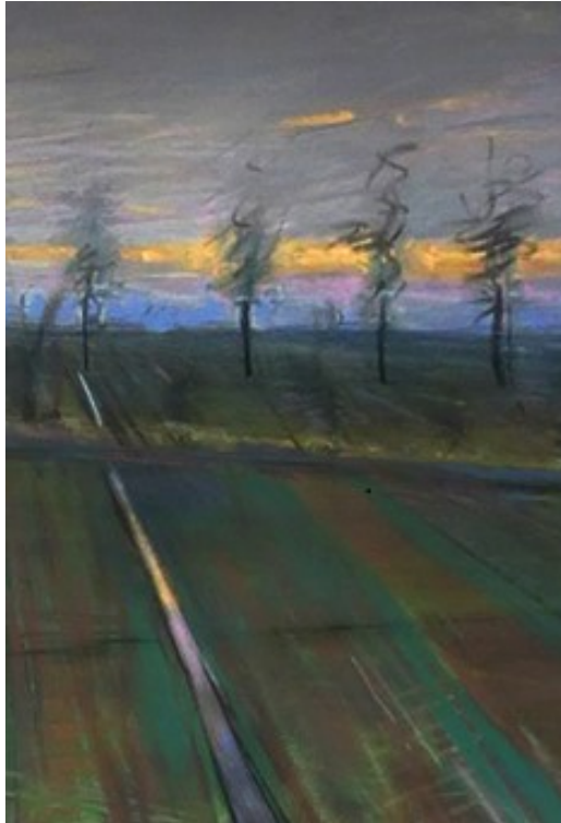
Alfredo Tigani, Tramonto (particolare) *